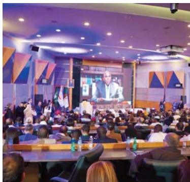
Par Abed Meghit

La capitale Alger a accueilli la 12e édition du Forum africain de l'investissement et du commerce dans un contexte marqué par une volonté croissante des pays du continent de renforcer leur intégration économique et de construire un modèle de développement fondé sur la coopération régionale.