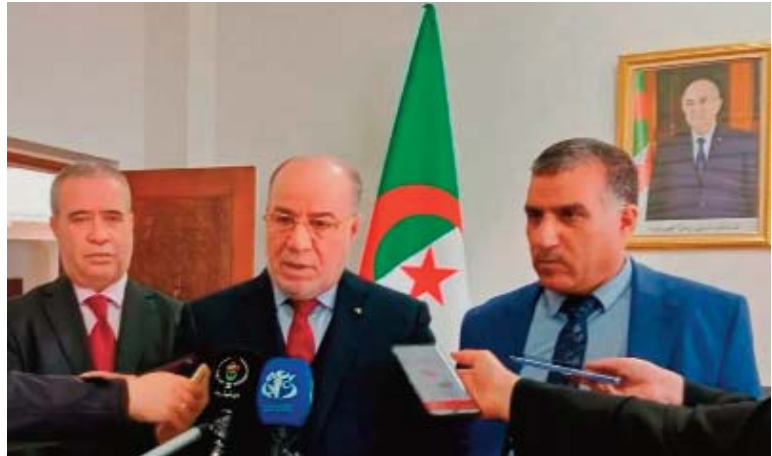
et de la omra (ONPO), ont quitté le pays il y a quelques jours pour s'enquérir des derniers préparatifs avant le début de l'arrivée des pèlerins sur les Lieux Saints.

Des membres de la mission, représentant le ministère des Affaires religieuses et des Wakfs et autres secteurs, ainsi que l'Office national du pèlerinage