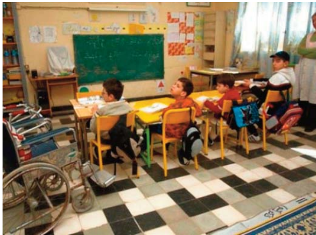
cours pour le réaménagement du Centre psychopédagogique pour enfants déficients men-

Le même responsable a souligné d'autre part que des travaux sont en