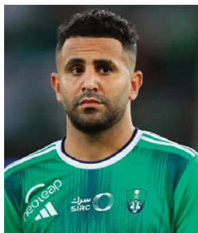
patte gauche magique en offrant la qualification aux siens, sur un superbe coup franc direct (117').

"Je fais toujours le maximum pour rendre heureux les supporters d'Al-Ahli. Je suis satisfait de mes performances et je continuerai à travailler avec sérieux afin de contribuer au succès du club, aussi bien sur le plan national que continental", a-t-il ajouté. Mahrez avait rejoint Al-Ahli SC en 2023 pour un contrat de quatre saisons, en provenance de Manchester City.