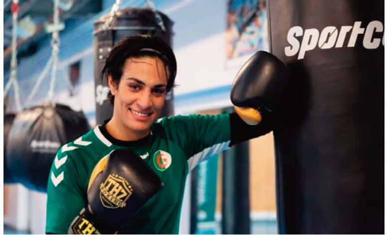
Par Abed MEGHIT

Une nouvelle page s'ouvre dans la carrière d'Imane Khelif, figure emblématique de la boxe algérienne, qui s'apprête à faire ses premiers pas dans le monde professionnel.