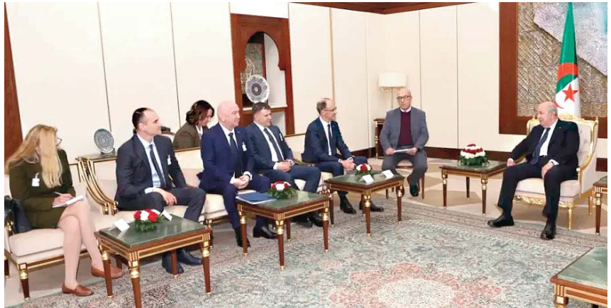
Cette rencontre confirme la volonté des deux pays de renforcer leur coordination et de bâtir un partenariat durable, fondé sur des intérêts mutuels et une vision commune.

Les échanges ont également porté sur les enjeux régionaux et internationaux, mettant en avant la convergence de vues entre Alger et Belgrade sur le respect du droit international et la promotion de la stabilité.