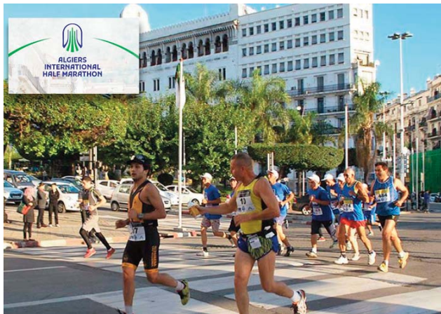
rues d'Alger-Centre et la rue « Aslah Hocine ».

Chacun des deux tracés offrira un panorama exceptionnel sur la ville blanche, du front de mer d'« El Kettani à Rais Hamidou », en passant par le stade de Bologhine, les