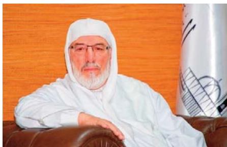
Par Abed Meghit

Fidèle à sa vocation de phare spirituel et intellectuel, l'Algérie prend part activement aux grandes rencontres internationales consacrées à la pensée islamique et à la vie du Prophète Mohammed (QSSSL).