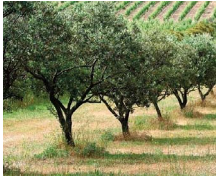
Mme Othmane. Des superficies seront également réservées à la

Ces arbres seront plantés dans plusieurs localités, notamment à Aïn El Turck, Boutlelis, Bethioua, Es-Senia, Oued Tlelat et Arzew, a précisé