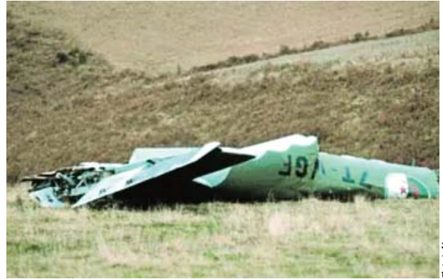
Monsieur le Général d'Armée a ordonné l'ouverture d'une enquête pour élucider les causes et les circonstances de cet accident. A Allah nous appartenons et à Lui nous retournons", conclut la même source.

"En cette douloureuse circonstance, Monsieur le Général d'Armée, Saïd Chanecriha, ministre délégué auprès du ministre de la Défense nationale, Chef d'Etat-major de l'Armée nationale populaire, présente en son nom personnel et au nom de l'ensemble des personnels de l'Armée nationale populaire, ses sincères condoléances aux membres de la famille et proches du Chahid et leur fait part de sa profonde compassion, prie Allah le Tout-Puissant de leur prêter force et courage et d'accorder au défunt Sa sainte miséricorde et de l'accueillir en Son vaste paradis", ajoute le communiqué. "Suite à ce tragique accident,