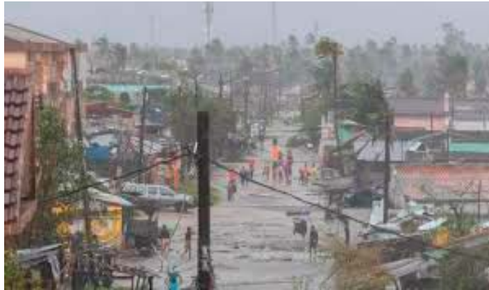
tastrophe 4 (INGD), le cyclone Jude avait fait au moins six morts, 20 blessés et touché plus de 9 500 habitants dans les provinces de Nampula, Niassa et Zambézie.

EDM a rappelé que "74 km de lignes moyenne et basse tension ont été endommagées, ainsi que l'effondrement de six postes de transformation et de deux pylônes haute tension sur la ligne reliant Namialo à Monapoque". Le cyclone Jude a touché terre dimanche soir, soufflant des vents dépassant les 120 km/h. Selon l'Institut national pour la réduction et la gestion des risques de ca-