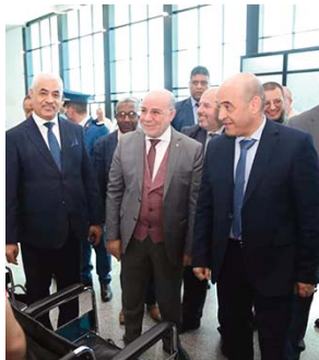
Bouira, de Ain Defla, de M'sila, de Tissemsilt et de Bordj Bou Arreridj.

Un total de 14.387 pèlerins seront transportés via l'Aéroport international d'Alger cette année, provenant des wilayas d'Alger, de Chlef, de Blida, de Médéa, de Boumerdes, de Tipaza, de Béjaïa, de Tizi-Ouzou, de