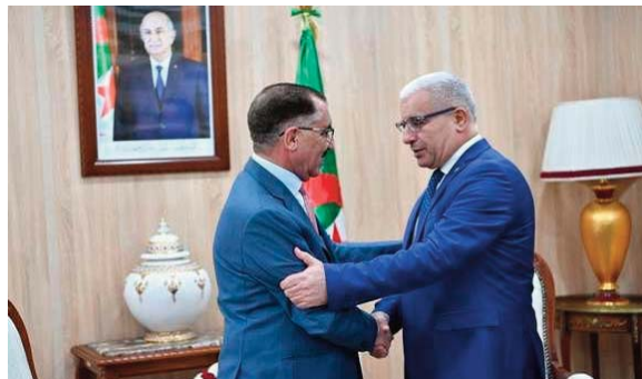
entamé, dimanche, une visite en Algérie, qui s'inscrit dans le cadre des préparatifs en cours, en vue de la tenue de la prochaine conférence de l'UIPA.

Le SG de l'UIPA, par ailleurs, salué "la position de l'Algérie sur ce qui se déroule en Palestine occupée de manière générale et dans la bande de Gaza en particulier, comme génocide méthodique perpétré par l'entité sioniste à l'encontre des Palestiniens parmi les enfants et les femmes". M. Al-Chawabka a, en outre, souligné que l'Algérie "apporte le plus grand soutien à la cause palestinienne et nul ne pourrait nier son rôle, d'autant qu'elle a été à l'avant-garde dans l'adoption des positions de soutien aux causes justes" dans le monde. Le SG de l'UIPA a