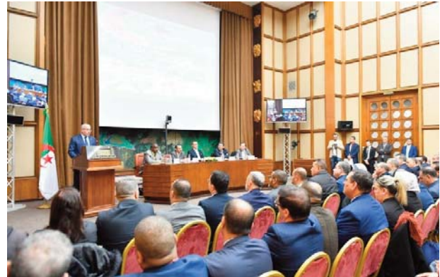
cette Journée parlementaire, qui sera sanctionnée par une série de recomman-

Les participants aborderont également "le rôle des entités économiques privées dans le soutien à la politique de l'emploi", ajoute la même source. Un débat général est également prévu lors