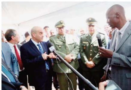
«Chikh Sidi-Mohamed-Belkebir» (Adrar) devant programmer des vols internationaux directs vers les Lieux-Saints.

Le ministre a affirmé, par la même, que la promotion et la modernisation des services de transports destinés aux citoyens étaient au cœur des intérêts du ministère, appelant les responsables de son secteur à sensibiliser les opérateurs privés à adhérer les démarches visant à la promotion du service public. Le premier responsable s'est dit satisfait des efforts consentis par les autorités locales pour la modernisation des services de l'aéroport de Touat