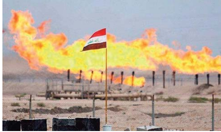
couvre près d'un tiers des besoins énergétiques de l'Irak. L'un des protocoles d'accord a été conclu avec

Le chef du gouvernement qui avait entamé samedi une visite de sept jours aux Etats-Unis, a assisté mercredi à la signature de dizaines de protocoles d'accord portant notamment sur la réhabilitation des centrales électriques irakiennes et l'exploitation du gaz libéré et actuellement brûlé sur les champs pétroliers. Actuellement les centrales électriques irakiennes sont ultra-dépendantes du gaz fourni par l'Iran voisin, qui