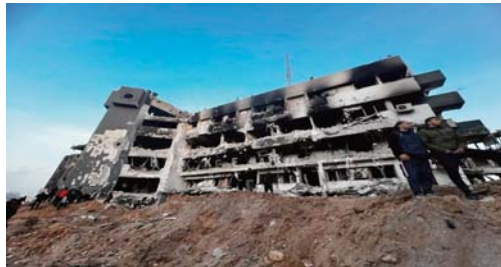
forces d'occupation sionistes contre les Palestiniens à Ghaza. En outre, à al-Khair, une autre maternité de Khan Younés, «il ne semblait pas y avoir le moindre équipement médical en état de

sant aux journalistes à Genève par liaison vidéo depuis Al-Qods occupée, M. Allen a décrit avoir vu «du matériel médical volontairement brisé, des échographes - qui, vous le savez, sont un outil très important pour garantir des accouchements sûrs - avec des câbles coupés». «Des écrans d'équipements médicaux sophistiqués, comme des échographes et autres matériels, ont été brisés», a-t-il ajouté. L'Organisation mondiale de la santé (OMS) avait décrit la difficulté d'introduire de tels équipements à Ghaza avant même les agressions actuelles menées depuis le 7 octobre dernier, par les