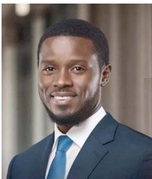
L'Algérie à renforcer les liens d'amitié et à promouvoir la coopération bilatérale, dans

"Le président de la République, M. Abdelmadjid Tebboune, a félicité, ce jour, le président élu du Sénégal, Bassirou Diomaye Faye, lui exprimant, au nom du peuple et du gouvernement algériens, ses sincères vœux de réussite dans l'accomplissement de sa noble mission, tout en réaffirmant la disposition de