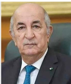
l'intérêt des deux peuples frères", lit-on dans le communiqué.