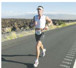
L'homme comme chez la femme) lors d'épreuves de longue durée.

Les articulations des chevilles et des genoux peuvent subir des entorses et d'autres problèmes de ligaments. La peau, en particulier celle des pieds, subit lors de courses de longue distance des frottements répétés qui peuvent provoquer des ampoules (phénomènes), surtout lorsqu'elle est ramollie par l'humidité qui règne dans la chaussure. Des irritations dues au frottement contre les vêtements peuvent apparaître au niveau des aisselles et des mamelons (chez