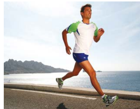
corps. Un entraînement régulier renforce les muscles, les ligaments et les tendons, éliminant dans le même temps le risque de blessures.

En plus de garantir un poids stable (à condition de ne pas se jeter sur un pot de glace après la séance), le running tonifie le bas du