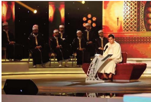
réats de cette édition seront annoncés le dernier vendredi du mois sacré lors d'une cérémonie spéciale.