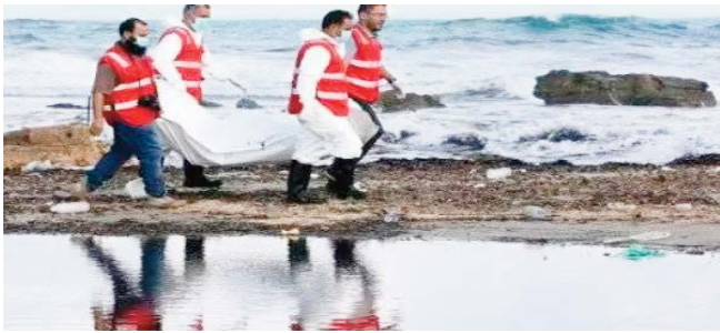
La nationalité des migrants n'a pas été précisée. Le gouverneur de Canakkale a déclaré à l'agence de presse Anadolu que le naufrage avait eu lieu dans la nuit.

Des garde-côtes ont été dépêchés sur les lieux pour tenter de secourir d'autres personnes tandis que des hélicoptères, des drones et un avion survolent la zone, ont précisé les autorités locales dans un communiqué.