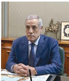
dustrielle, pharmaceutique et agricole, de l'industrie agroalimentaire et des produits pétroliers et miniers. Le

Conseil a, également, évoqué le développement de l'action des dispositifs et organes concernés par l'accompagnement des opérateurs économiques, tant à l'intérieur du pays qu'à l'étranger, ajoute le communiqué.