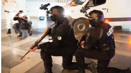
de vigilance et de réponse aux situations sécuritaires d'urgence, à renforcer la coordination entre les différents

«Le rectorat de Djamaâ El-Djazaïr informe l'opinion publique que les services de la Sûreté nationale effectueront mercredi soir une manœuvre au niveau de la salle de prière et du périmètre de la mosquée pour simuler une opération d'évacuation des fidèles et des visiteurs, en cas de signalement d'une menace sécuritaire». Selon la même source, cette manœuvre «vise à tester la préparation des structures de Djamaâ El-Djazaïr, à évaluer le niveau