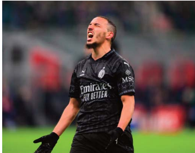
bard a conforté sa troisième place avec 52 points, à huit points provisoirement sur son voisin et leader l'Inter Milan, qui compte un match en moins.

À l'issue de cette victoire, le club lom-