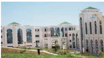
Telecom, la société Arab transformation de métaux, Metal, spécialisée dans la l'établissement public de

Les quatre conventions ont été signées avec Algérie