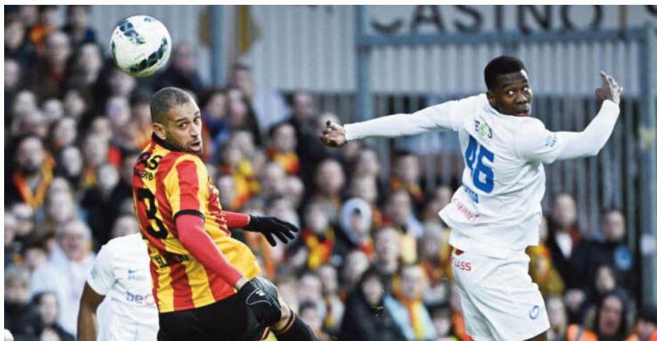
(Portugal) a été retenu pour la CAN-2023 (reporté à 2024) en Côte d'Ivoire, qui a vu

l'équipe nationale quitter le tournoi dès le premier tour.