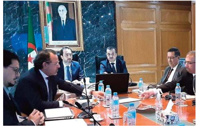
ment durable du secteur minier en Algérie", conclut la source.

Les discussions ont également porté sur "la stratégie tracée et les plans adoptés pour stimuler l'investissement dans le secteur minier, notamment en ce qui concerne les études géologiques, la recherche, la prospection, l'exploitation minière et l'industrie de transformation minière". Les deux parties ont convenu, dans ce sens, de "renforcer la coopération et d'intensifier les consultations afin d'assurer une mise en œuvre efficace des initiatives, à travers la tenue de rencontres consultatives et l'intensification des rencontres afin de définir les mécanismes efficaces pour œuvrer à la promotion des investissements nationaux et étrangers, dans l'objectif de réaliser un développe-