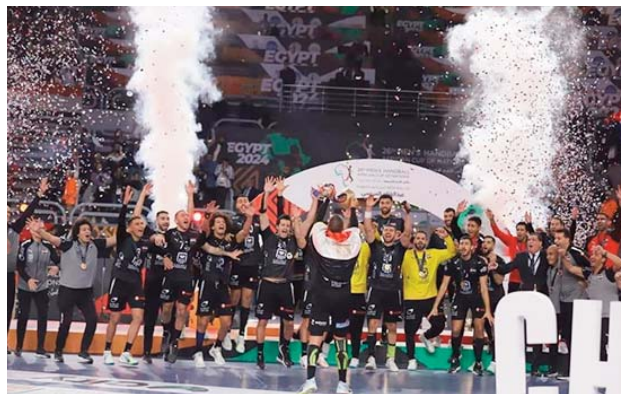
Tunisie, le Cap Vert et la Guinée.

Cette 26e édition du CAN a également enregistré la qualification des cinq premiers au classement au Championnat du monde 2025 prévu en Croatie, Danemark et Norvège. Il s'agit de l'Egypte, l'Algérie, la