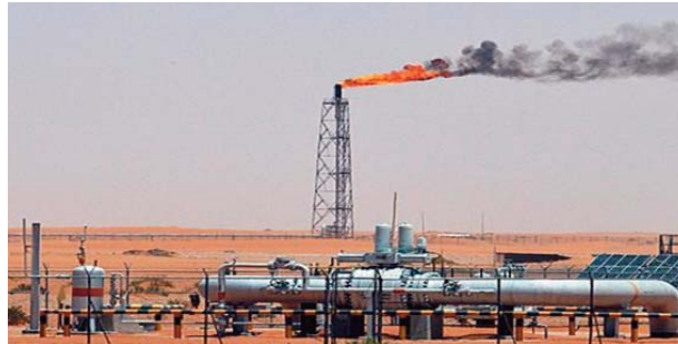
prix de vente du baril d'Aramco en Asie.

Ce champ pétrolier produit en temps normal 315.000 barils par jour, sur une production nationale de plus de 1,2 million de barils par jour. La veille, les prix du brut avaient brièvement sombré de près de 5% après l'annonce de la réduction du