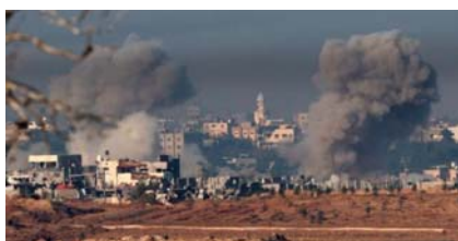
déplacés de force. "Près de 1,2 million de déplacés internes ont été enregistrés dans 154 installations des agences onusiennes à travers la bande de Ghaza", a-t-il ajouté.

"La quantité d'aide qui arrive à Ghaza est encore largement insuffisante", assure le ministère qui déplore "la poursuite du bombardement par les forces d'occupation des routes, des convois humanitaires, des structures médicales, ainsi que des installations électriques". Il a, enfin, noté que 85% de la population de Ghaza (environ 1,93 million de civils) ont été