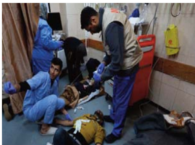
l'agression sioniste contre la Bande de même source. Le

"Cela intervient à la lumière de la situation épidémiologique critique" provoquée par