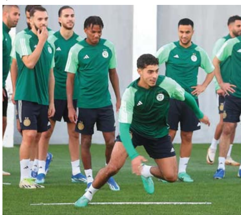
roulera dans cinq villes ivoiriennes : Abidjan, Bouaké, Koro, Yamoussoukro et San Pedro.

Les deux premiers de chaque groupe ainsi que les quatre meilleurs troisièmes se qualifient pour les 8es de finale de cette 34e édition, qui se dé-