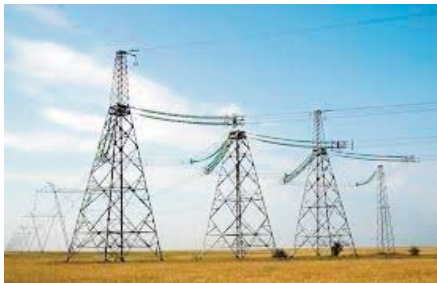
En sus, 272 projets de raccordement de 1.900 exploitations agricoles sont actuellement au stade des procédures d'at-

Ces projets menés par cette direction en coordination avec la direction de wilaya des services agricoles (DSA) bénéficieront à 1.554 exploitations agricoles à travers les divers périmètres agricoles, a précisé à l'APS la même source. Ils portent sur la réalisation de réseaux de lignes de tension diverses et de transformateurs, selon la même source qui a indiqué que 20 des projets affichent un taux d'avancement des travaux supérieur à 80 %, tandis que les autres affichent des taux allant de 10 % à 50 %.