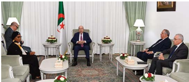
L'audience s'est déroulée en présence du directeur de Cabinet par intérim de la Présidence de la République, M. Boualem Boualem, et du ministre de la Justice, garde des Sceaux, M. Abderrachid Tabi, précise la même source.

Le Président de la République, M. Abdelmadjid Tebboune, a reçu, lundi à Alger, la présidente de la Cour africaine des droits de l'homme et des peuples (CAFDHP), Mme Imani Daud Aboud, indique un communiqué de la Présidence de la République.