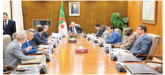
Les amendements remplissant les conditions légales ont été soumis aux commissions compétentes en vue de leur examen avec les délégués de leurs auteurs, a conclu le communiqué.

A noter que le bureau de l'APN avait entamé les travaux de sa réunion par l'examen des amendements proposés aux trois textes de lois débattus la semaine dernière. Il s'agit du projet de loi relatif à la presse écrite et à la presse électronique, du projet de loi sur l'activité audiovisuelle et de la proposition de loi organique modifiant et complétant la loi 18-15 relative aux lois de finances.