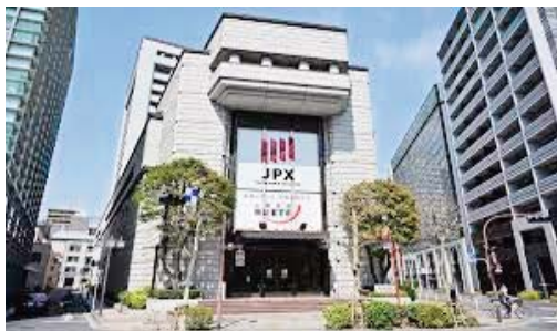
GMT le baril de WTI américain cé- dait 0,35% à 76,90 dollars et le baril de Brent de la mer du Nord aban- donnait 0,28% à 81,20 dollars.

L'indice vedette Nikkei, reparti sur une tendance positive depuis deux semaines, gagnait 0,68% à 32.791,07 points vers 00H40 GMT et l'indice élargi Topix prenait 0,42% à 2.346,50 points. Le cours dollar/yen était quasi stable, le billet vert s'échangeant pour 151,50 yens vers 00H35 GMT contre 151,52 yens vendredi dernier à 21H00 GMT. L'euro variait à peine aussi face à la monnaie japonaise, à raison d'un euro pour 161,88 yens contre 161,92 yens en fin de semaine dernière. La monnaie européenne se négociait par ailleurs pour 1,0685 dollar, un niveau quasi inchangé par rapport à vendredi. Le marché du pétrole reculait lundi matin en Asie: vers 00H25