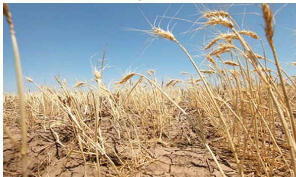
L'opération de recensement des agriculteurs touchés par la sécheresse est intervenue suite à l'expertise menée par la CNMA, selon la même source.

La liste définitive a été établie après l'approbation par la commission technique de wilaya chargée de la sécheresse, lors d'une réunion tenue, hier dimanche au siège de la Direction des services agricoles (DSA), en présence des représentants de plusieurs instances, à l'instar de la Caisse régionale de mutualité agricole, la CCLS, la Chambre agricole, l'Union nationale des agriculteurs et les chefs de sub divisions agricoles, a-t-on ajouté.