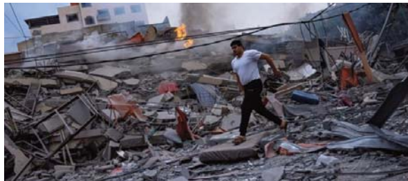
les écoles de l'UNRWA, l'agence de l'ONU pour les réfugiés palestiniens.

Outre les martyrs, plus de 187.500 déplacés ont été enregistrés à l'intérieur de la bande de Ghaza depuis samedi, selon le Bureau de coordination des affaires humanitaires de l'ONU (Ocha). La plupart se réfugient dans