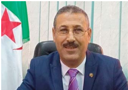
Le président de l'APN, Brahim Boughali, a adressé en cette triste occasion, un message de

Connu pour ses activités dans plusieurs associations, comme les Scouts musulmans algériens, il a été élu député à l'APN pour le Mouvement de la société pour la paix (MSP) pour le mandat en cours. Le président de l'APN, Brahim Bou-