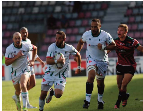
Rugby Seven Series. Pour les dames, le Rugby Afrique n'a pas encore procédé au tirage au sort des groupes, mais a officialisé la tenue du tournoi de qualification pour les 14 et 15 octobre en Tunisie.

Versée dans la poule C, l'Algérie débute le tournoi samedi face à l'Ouganda (8h20, heure algérienne) avant d'enchaîner le même jour face au Zimbabwe (10h45), puis le Burkina Faso (13h50). La poule A est composée de l'Afrique du Sud, de Madagascar, de la Tunisie et de la Côte d'Ivoire, alors que la poule B regroupe le Kenya, la Zambie, la Namibie et le Nigeria. Chaque vainqueur de groupe sera directement qualifié pour le tournoi olympique, alors que les 2èmes des poules passeront par un tournoi de barrages. A ces trois places assurées pourrait s'en ajouter une 4ème, si l'Afrique du Sud décroche sa qualification via la World