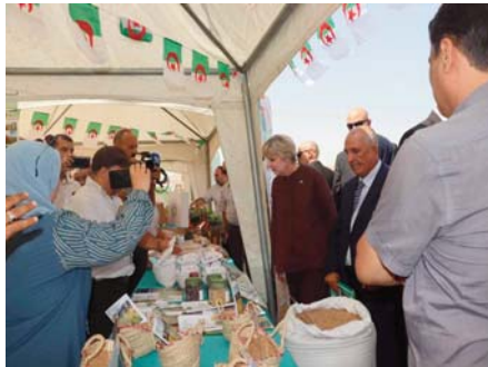
"prospective les possibilités de renforcer sa contribution à la promotion du secteur agricole

en Algérie et d'intensifier les échanges entre les agriculteurs des deux pays, notamment