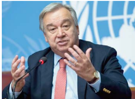
terrorisme a pour thème "Notre héritage: retrouver l'espoir et bâtir un avenir pacifique". Il a, en outre, salué le travail

Cette année, la journée internationale du souvenir en hommage aux victimes du