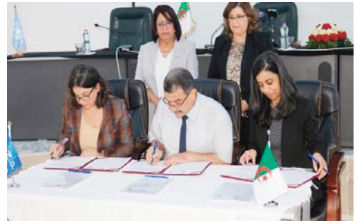
ministériels, pour l'élaboration du Plan national Climat (PNC). Adopté en septembre 2019, le PNC comporte 155 projets, dont 76 rela-

engagements conformément aux exigences de l'Accord de Paris en matière de financement, alors que nous avons à subir la part la plus importante des effets négatifs de ces changements, qui impactent de manière directe notre sécurité alimentaire, hydrique et énergétique". "L'Algérie soutient et œuvre pour la transition vers des modes de production et de consommation durables, en recourant à des technologies à faibles émissions, selon nos propres capacités et conditions", a ajouté la ministre. Juste après la ratification de l'Accord de Paris sur le climat, en octobre 2016, l'Algérie avait lancé une consultation nationale, sous l'égide du ministère de l'Environnement et avec la participation de 18 départements