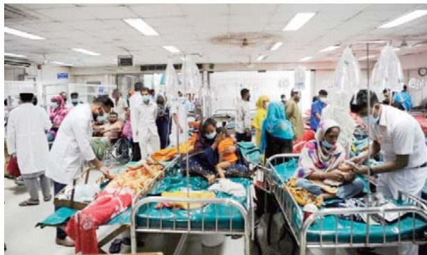
75.280, a indiqué la DGHS. Le nombre de 147 en août, 204 en juillet et 34 en juin.

Au cours des 24 dernières heures, 2.991 patients guéris ont quitté l'hôpital, portant leur nombre total dans le pays à