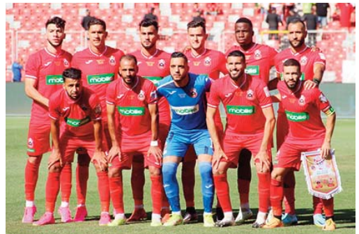
coupe de la CAF par l'USM Alger, détentrice du trophée de la précédente édition de cette épreuve, rappelle-t-on.

Outre les Chélifiens, l'Algérie sera représentée aussi dans la