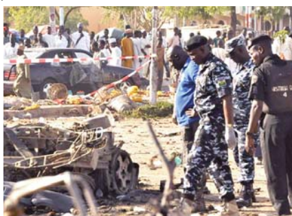
medi en fin de journée, les terroristes de Boko Haram ont rassemblé dix agriculteurs et les ont abattus alors qu'ils travaillaient sur leur champ dans un village en périphérie de

"Les soldats les ont engagés dans une bataille féroce au cours de laquelle trois soldats ont été tués avant que l'attaque ne soit maîtrisée et que les assaillants ne soient contraints de se retirer", a-t-il ajouté. Sa-