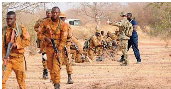
(RTB). Depuis 2015, le Burkina Faso est la cible d'attaques terroristes ayant fait de

Les assaillants étaient estimés à 200 personnes et beaucoup d'entre eux ont été neutralisés par les frappes, a rapporté la Radiodiffusion Télévision du Burkina