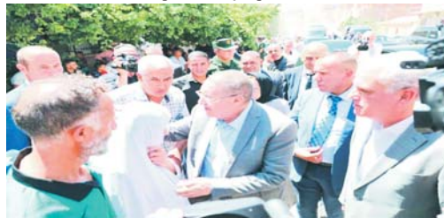
de maîtriser les incendies et de freiner leur propagation". Il a également salué la "contribu-

gné de la ministre de la Solidarité nationale, de la Famille et de la Condition de la femme, Mme Kaoutar Krikou, a souligné que cette indemnisation "concrétise les engagements du président de la République, M. Abdelmadjid Tebboune, d'indemniser sans tarder les victimes des incendies dans les wilayas où les commissions en charge du recensement et de l'évaluation des pertes ont achevé leur travail". Le ministre de l'Intérieur a affirmé que les interventions rapides des éléments de la protection civile, des agents des conservations des forêts et des éléments de l'Armée nationale populaire ont "permis de circonscrire et