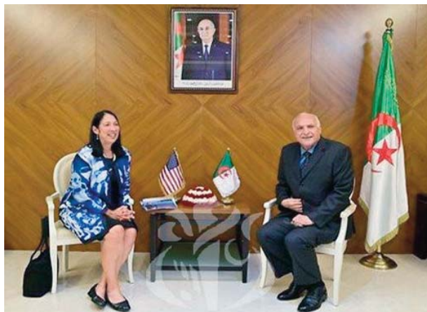
a présenté la candidate américaine à la Cour internationale de justice (CIJ), Pr. Sarah Cleveland, ajoute la même source.