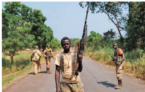
obligations en vertu du droit international humanitaire et du droit international des droits de l'homme, pour assurer la sécurité de tous les civils".

La mission exhorte toutes les forces concernées à "arrêter immédiatement les opérations militaires afin de calmer la situation et d'empêcher le conflit de s'étendre, et nous les appelons à reprendre les négociations". La mission de l'ONU rappelle, selon le communiqué, à "toutes les parties leurs