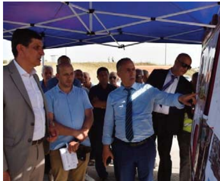
toyens et des visiteurs de la capitale venant de l'intérieur du pays et de l'étranger".

Cette visite, ajoute la source, s'inscrit dans le cadre des efforts visant à "imprimer une dynamique touristique et économique et créer des espaces garantissant le confort des ci-