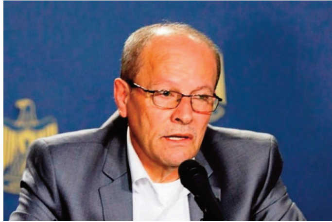
ex-détenus à partir de 2018. Il a été emprisonné par l'entité sioniste pendant 17 ans, pour son rôle dans la résistance contre l'occupation.