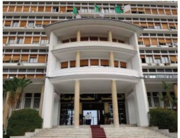
opérabilité des systèmes d'information des différentes administrations et institutions", ajoute le communiqué.

Ce nouveau dispositif prévoit également de "dispenser les personnes titulaires de documents biométriques d'identité, de circulation ou de séjour, de présenter les documents pouvant être obtenus par le biais du NIN et ce, grâce à l'inter-