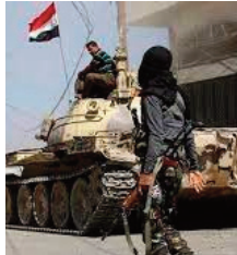
même temps que l'arrivée de renforts Houthis près des positions des forces gouver-

Il a précisé que l'attaque du drone avait tué quatre soldats et en avait blessé plusieurs autres, tout en endommageant le site militaire, un véhicule blindé ayant été complètement détruit. L'attaque a eu lieu en