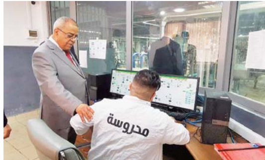
Prénoms du ministère, en vue de la finalisation des travaux de réhabilitation des ateliers et de l'allée centrale avant le

A cet effet, "il a donné instruction pour l'élaboration d'un programme de réhabilitation et de développement à soumettre aux services com-