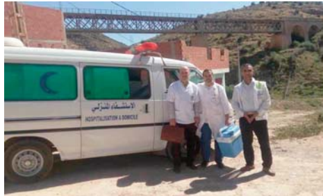
d'un personnel médical et paramédical spécialisé, ayant acquis une grande expérience pendant la pandémie Covid-19.

L'unité d'hospitalisation à domicile, devenue une référence dans la wilaya de Batna, dispose, selon la même spécialiste, de matériels et des équipements nécessaires, en plus