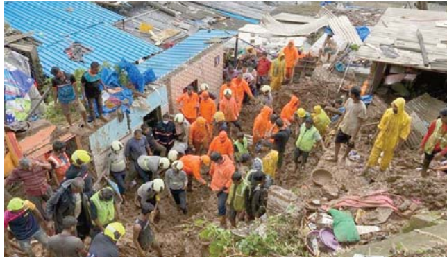
Khan. Le Premier ministre pakistanais, Shabbaz Sharif a ordonné à l'Autorité nationale de gestion des catastrophes et aux auto-

Cinq personnes auraient été tuées et 42 blessées dans le district de Lakki Marwat, a indiqué la PDMA. Dans le district de Karak, quatre personnes ont été tuées et une autre blessée, ont indiqué les autorités, ajoutant qu'une personne a été tuée et deux autres blessées dans le district de Dera Ismail