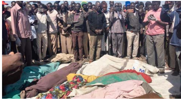
d'expulsions forcées". Des combats meurtriers opposant l'armée régulière et les

Le dernier bilan communiqué par le syndicat, vendredi, faisait état de 524 morts et 2.872 blessés civils. Par voie de communiqué, le syndicat a ajouté que "59 hôpitaux ont été fermés à cause des violences, 17 ont été bombardés et 20 autres ont fait l'objet