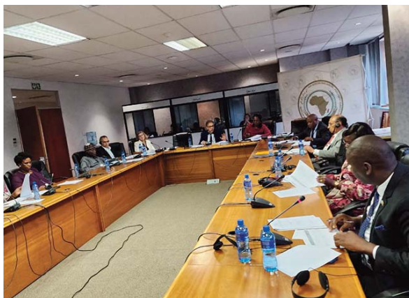
"saluée et soutenue" par les membres participant à cette réunion, selon le communiqué.