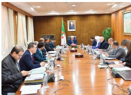
Le bureau de l'Assemblée populaire nationale (APN) a tenu, mardi, une réunion consacrée à l'examen des questions orales et écrites déposées à son niveau pour soumettre celles répondant aux conditions légales au Gouvernement, a indiqué un communiqué de cette instance législative.

Avant le début des travaux de cette réunion, présidée par le président de l'APN, M. Brahim Boughali, le bureau a salué les décisions issues de la dernière réunion du Conseil des ministres notamment les instructions données qui reflètent l'attachement du Président de la République, M. Abdelmadjid Tebboune à poursuivre la stratégie visant à améliorer le niveau de vie des citoyens, et ce à travers l'amendement de la loi relative à la retraite, l'augmentation de l'allocation de solidarité et la réduction du coût du Hadj", précise le communiqué. Le bureau de l'APN s'est également "félicité des instructions données par le Président de la République en vue d'encadrer le sport scolaire et universitaire, se disant optimiste de voir ces sages décisions