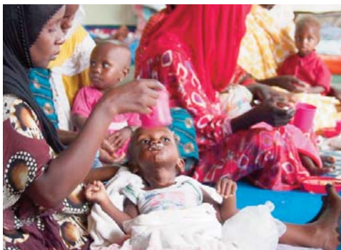
soit une multiplication par quatre au cours des cinq dernières années". Chris Nikoi, directeur régional du PAM pour l'Afrique

Le Programme alimentaire mondiale (PAM) a déclaré que "les effets combinés des conflits, des chocs climatiques, du Covid-19 et des prix élevés des denrées alimentaires continuent d'augmenter la faim et la malnutrition dans la région, car le nombre de personnes qui n'ont pas régulièrement accès à des aliments sûrs et nutritifs devrait augmenter à 48 millions pendant la période de soudure qui dure entre juin et août 2023,