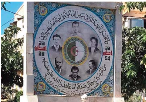
CRUA dont notamment la réunion du Comité des 22 révo-

Il a rappelé également que le CRUA a vu le jour dans l'appartement sis à la rue Ammar Ali (Ali La Pointe) qui avait abrité le cercle "Errachad", citant, à ce propos, une série d'événements ayant suivi la naissance du