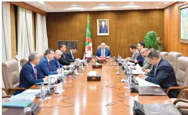
de l'Assemblée a soumis les amendements remplissant les conditions de forme à la commission lors de sa réunion tenue mercredi soir.

Présidée par Ahmed Mouaz, président de la commission, cette réunion a été consacrée à l'examen de "cinquante quatre (54) amendements proposés au projet de loi organique relatif à l'information", précise-t-on de même source. Le bureau